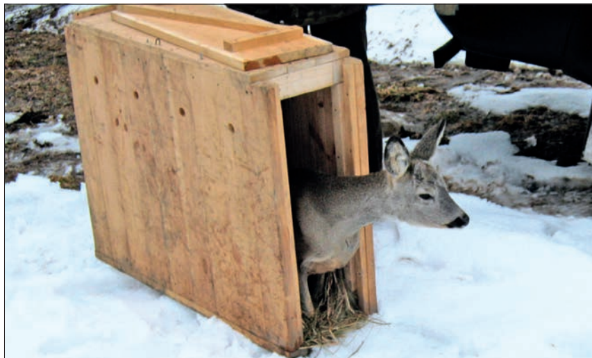
Ryc. 2. Koziołek sarny opuszcza skrzynię transportową po wybudzeniu