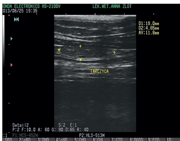
Ryc. 2. Badanie ultrasonograficzne płata lewego tarczycy, skan podłużny