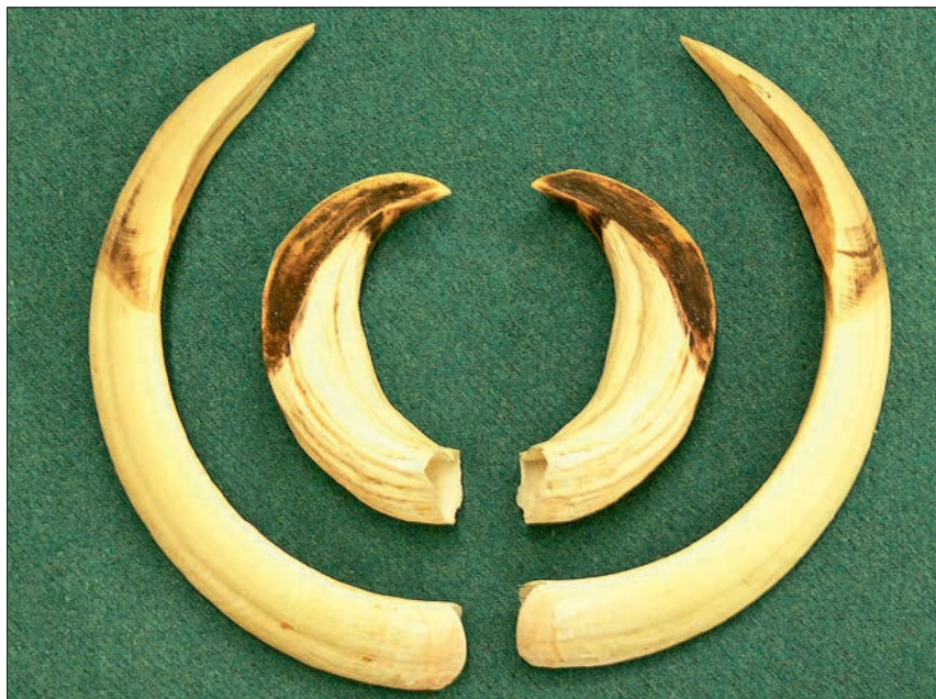
Ryc. 2. Kły dolne i górne stanowiące trofeum (oreź)